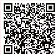
臺中市政府 勞工局