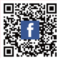
臺中市政府 勞工局FB