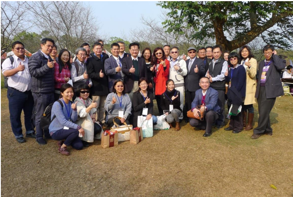
繽紛溫馨，賓主盡歡，收穫滿滿