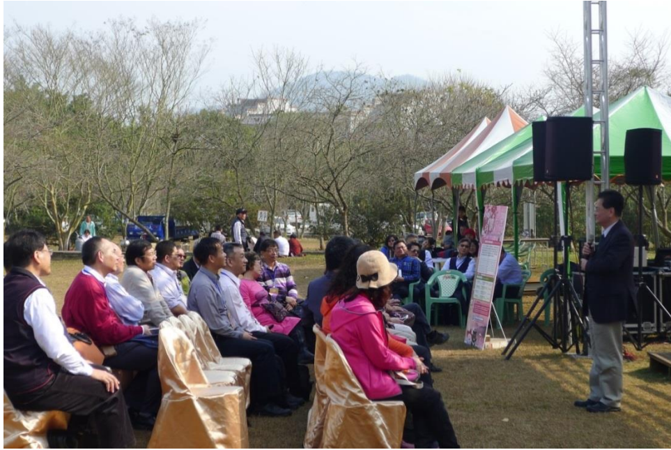
在地產業結合賞櫻開啟序幕