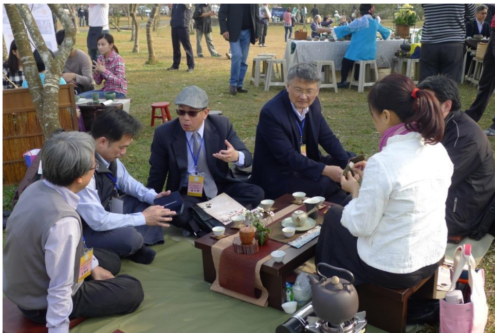
聞香品茗、樂音動人、緋紅櫻花林下氣氛輕鬆地交換工作經驗