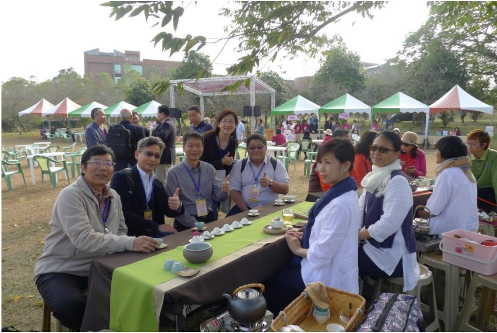
結合「櫻花」與「中國茶道」認識在地產業