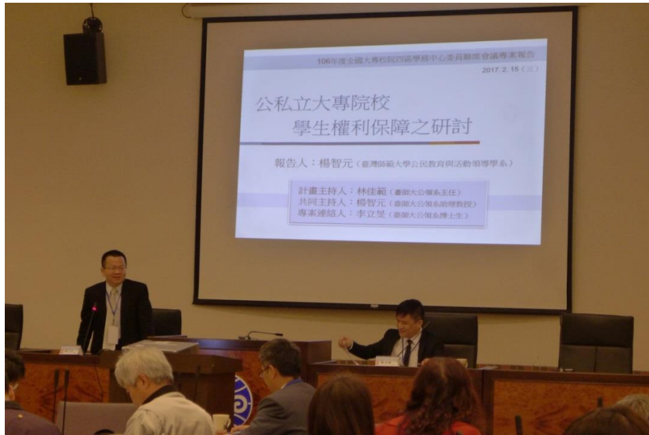
鄭司長主持「公私立大專校院學生權利保障之研討」