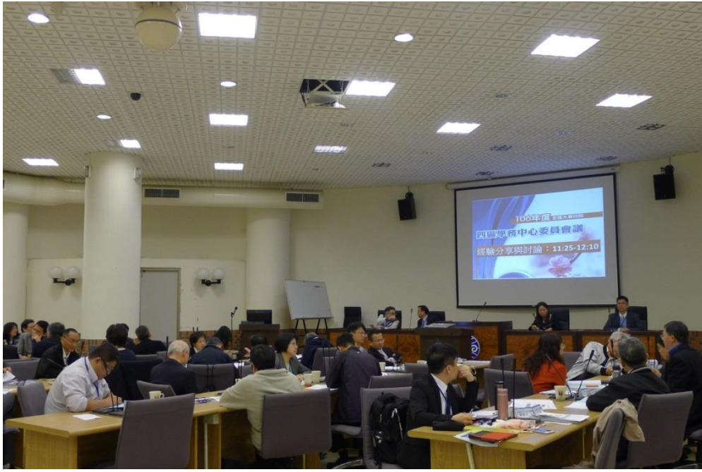
四區召集人共同主持經驗分享，大家討論熱烈