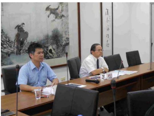
日期：105 年 8 月 18 日上午 9 時 30 分 地點：圖書館 7 樓第一會議室