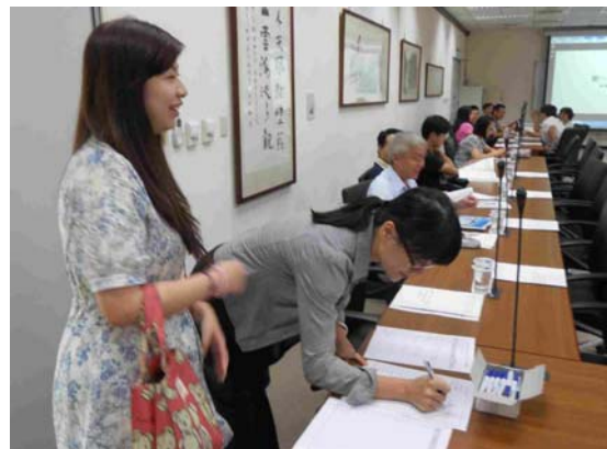
日期：105 年 8 月 18 日上午 9 時 30 分 地點：圖書館 7 樓第一會議室