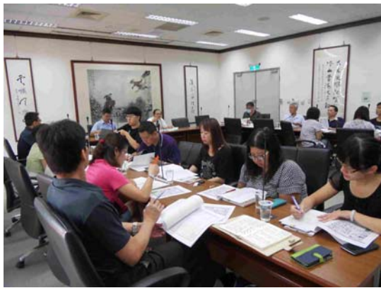
日期：105 年 8 月 18 日上午 9 時 30 分 地點：圖書館 7 樓第一會議室