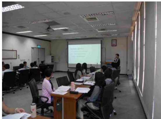
日期：105 年 8 月 18 日上午 9 時 30 分 地點：圖書館 7 樓第一會議室